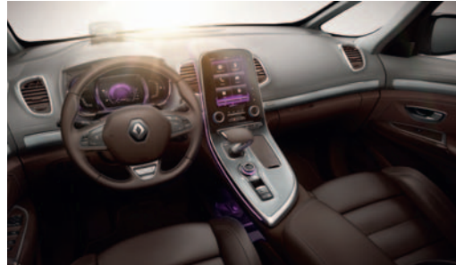
Pilkos ir rudos spalvos prietaisų skydas