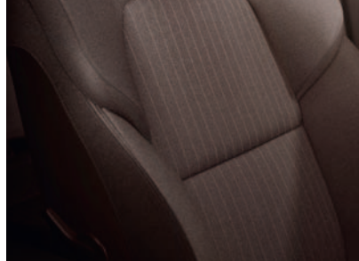
Rudos spalvos medžiaginiai apmušalai