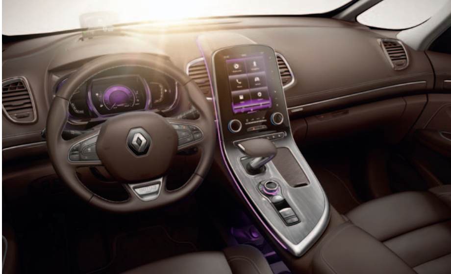
Nuotraukoje parodytas salonas su pasirinkama įranga (įskaitant ekraną Head-Up )