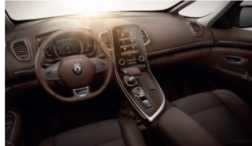
Rudos spalvos prietaisų skydas