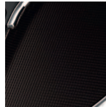
Centrinio valdymo pulto apdaila Dot Effect