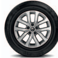
AQUILA 17" (pasirenkama įranga)