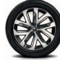
QUARTZ 19" (paketo dalis)