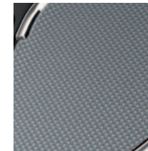
Centrinio valdymo pulto apdaila Hologram