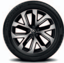
QUARTZ 19" tamsinti