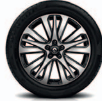
INITIALE PARIS 19"