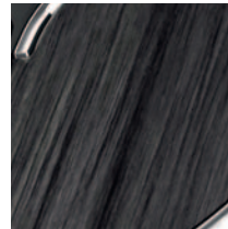
Centrinio valdymo pulto apdaila Silver Wood