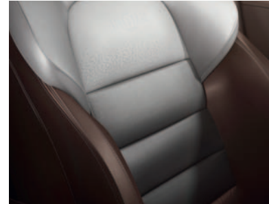
Pilkos ir rudos spalvos odiniai apmušalai