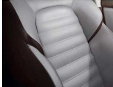
Šviesiai pilkos spalvos odiniai apmušalai