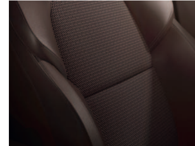
Rudi medžiaginiai apmušalai su dirbtinės ekologiškos odos elementais