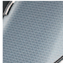
Šviesiai pilka raštuota centrinio valdymo pulto apdaila