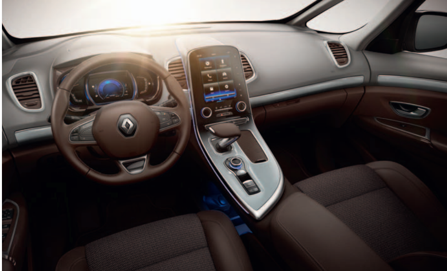
Nuotraukoje parodytas salonas su pasirinkama įranga