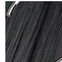
Centrinio valdymo pulto apdaila Silver Wood