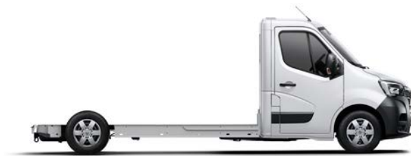
Platforma su kabina

Gaminami įvairūs naujojo RENAULT MASTER variantai, įskaitant savivartį. Važiukles su kabina arba platformas su kabina galima lengvai pritaikyti pačiai įvairiausiai paskirčiai.