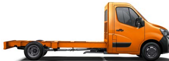
Važiuklė su kabina