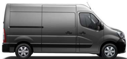
Furgonas (FWD, RWD, 4x4*)

Jūsų poreikiai labai įvairūs. Juos visus patenkins platus naujojo RENAULT MASTER vidaus įrangos, ilgio, aukščio, variklių ir kitų dalių pasirinkimas.