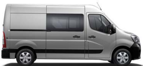
Brigadinis furgonas (FWD, RWD*)