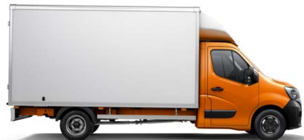
Furgonas su uždara dėže (FWD, RWD*)

* FWD – priekiniai varantieji ratai RWD – užpakaliniai varantieji ratai (viengubi (SGL) arba dvigubi (DBL) užpakaliniai ratai) 4x4 – visi varantieji ratai (viengubi (SGL) arba dvigubi (DBL) užpakaliniai ratai)